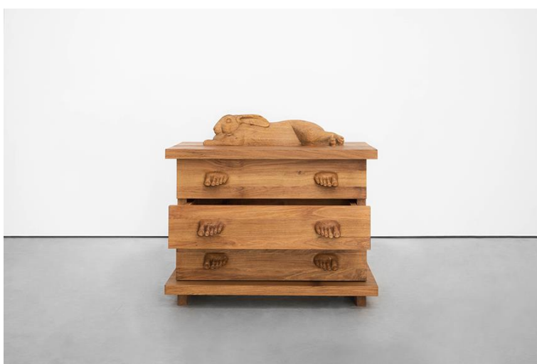
Daniel Dewar & Gregory Gicquel, Animals and Sculpture , Ausstellungsansicht CLEARING Brussels, 2020, © Benjamin Baltus / Courtesy of the artist and CLEARING New York, Brussels

Daniel Dewar, 1976 in Forest of Dean geboren, GB, lebt in Brüssel.