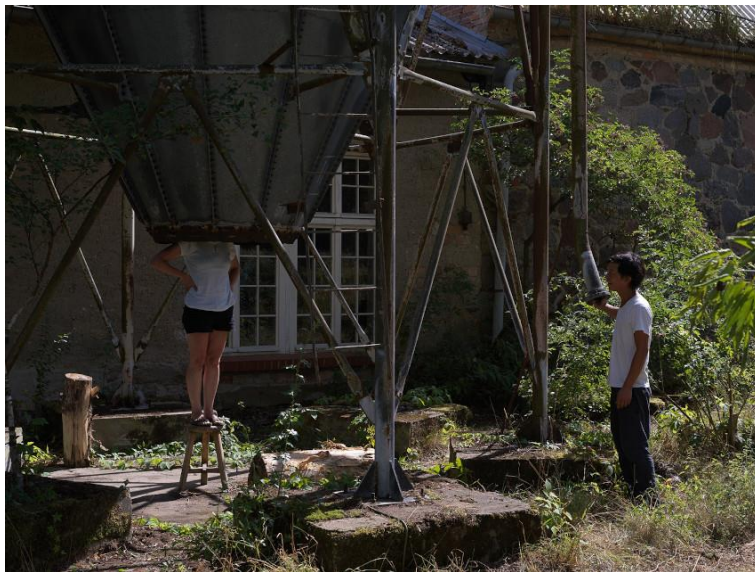
Studio Danh Vo Güldenhof

„Um die Gegenwart untersuchen zu können, muss man die Vergangenheit verstehen: jene Vergangenheit, die die eigene Gegenwart bestimmt. Ich glaube auch, dass man in die Zukunft schauen muss. Das ist zweifellos eine Lebensphilosophie, mit der ich lebe und die, wie ich hoffe, in meiner Arbeit zum Ausdruck kommt.“ (Danh Vo, Begleitheft zur Ausstellung untitled in der South London Gallery, 2019)