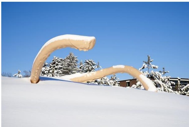
Nairy Baghramian, Privileged Points , 2017, Installationsansicht Minneapolis Sculpture Garden & Wurtele Upper Garden, Walker Art Center Minneapolis 2017, Courtesy the artist, Marian Goodman Gallery, Galerie Buchholz, kurimanzutto, Foto: Timo Ohler

Nairy Baghramian setzt sich meist ausgehend vom menschlichen Körper mit den grundlegenden Fragen der Bildhauerei auseinander, entwirft mit ihren Skulpturen und Installationen jedoch ganz bewusst eine Antithese zum traditionellen Skulpturenbegriff. In ihrer künstlerischen Formensprache, Materialwahl und Herangehensweise dem Postminimalismus gleichermaßen nahe stehend wie der Konzeptkunst, nutzt die Künstlerin das Potential der Abstraktion, um komplexe Fragestellungen zu verhandeln und für sie eine ästhetisch formale Entsprechung zu finden. Baghramian selbst spricht dabei von „ambivalenter Abstraktion“. Ihre Arbeit thematisiert zeitliche, räumliche und soziale Beziehungen zu Sprache, Geschichte und Gegenwart mit Formen, die sich als Reaktion auf Kontextbedingungen oder die Prämissen eines bestimmten Mediums materialisieren.