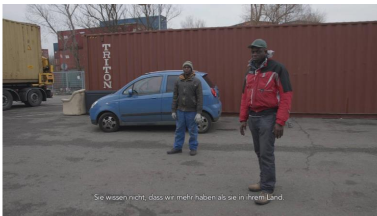
Karimah Ashadu, Brown Goods , 2020, Filmstill

Die Filmemacherin und Künstlerin Karimah Ashadu verhandelt in ihren Werken die Lebens- und Arbeitsbedingungen im sozioökonomischen Kontext Westafrikas, hier insbesondere Nigerias. Ihre Filme zeigen BäuerInnen in der Palmölproduktion, ArbeiterInnen einer Holzwerkstatt in der Lagune von Lagos, den Betrieb eines Sägeblattschleifers oder Porträts von Boxern. Ohne zu moralisieren, fokussiert Ashadu die Schönheit im Alltäglichen sowie die Selbstständigkeit der Menschen und ihren Emanzipationsversuch vor dem Hintergrund der Kolonialgeschichte, während sie zugleich durch ihre ungewöhnliche Art der Kameraführung gezielt die Grenze zwischen Dokumentation und Kunst unterläuft. In ihren frühen experimentellen Kurzfilmen setzt sie oft mit einfachsten Mitteln selbst konstruierte Apparate ein, um neue Perspektiven zu generieren und die Wahrnehmung der BetrachterInnen herauszufordern. King of Boys (Abattoir of Makoko) (2015) beispielsweise hält die Umtriebigkeit auf einem Schlachthof fest. Ein gefundener zerschnittener Plastikkanister dient als analoger Filter, der das Kamerabild bzw. Teile davon in eine intensive rote Farbe taucht und so eine seltsame Ambivalenz zwischen den gewaltsamen Aktivitäten des Schlachtens und der traumartigen, durchaus verführerischen Atmosphäre des roten Lichts erzeugt.