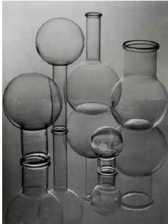
Albert Renger-Patzsch Werbeaufnahme für die Jenaer Werke, um 1935 Gelatinesilber, 38 x 28,2 cm ML/F 1977/655

Als entschiedener Gegner der künstlerischen Fotografie entwickelte Renger-Patzsch seinen präzisen und auf exakte Formenwiedergabe abzielenden Aufnahmestil, der ihn zu einem führenden Vertreter der sachlichen Fotografie in Deutschland machte. Bekannte Publikationen wie Die Welt ist schön zeigen seine Industriefotografien in einem programmatischen Kontext – sie stehen gleichermaßen als Dokumente und als ästhetische Leitbilder des technischen Zeitalters. 12