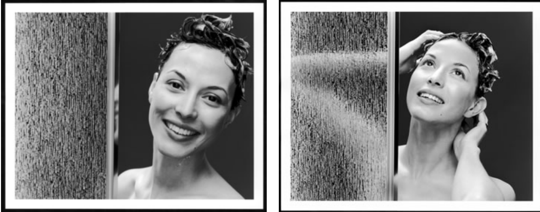
Christopher Williams, Model # 105M – R59C, Keystone Shower Door, 57,4 X 59" / Chrome / Raindrop, SKU # 109149 # 96235. 970 – 084 – 000 (Miko), Vancouver, B.C. Wednesday, April 6, 2005

Williams hält fest, was in der Welt war und im Moment seines Festhaltens schon wieder im Verschwinden begriffen ist. Mit Hilfe der perfekten Technik, dem Festhalten an verschwindenden fototechnischen Produktionsweisen, die größtmögliche Präzision ermöglichen, reflektiert er diesen Gedanken.