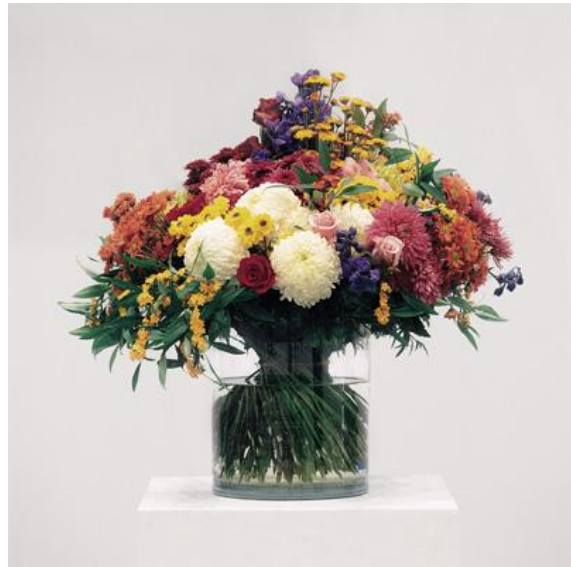
De Rijke / de Rooij, Bouquet I , 2002

Vergleiche die Zusammenstellung der Bouquets auf den Bildern.