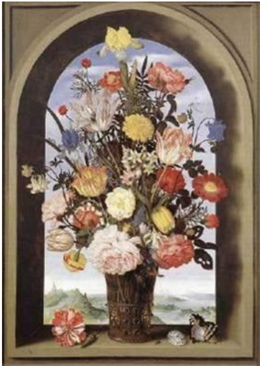
Ambrosius Bosschaert, Blumenstück , um 1620, Öl auf Holz, 64x64, Mauritshuis Den Haag

In der Malerei lassen sich verschiedene Bildgattungen feststellen. Solche Bildgattungen sind beispielsweise Altarbilder, Landschaftsbilder, Genre- und Sittenbilder, Architektur- und Stadtansichten, Landschaften, Stilleben und Porträts.