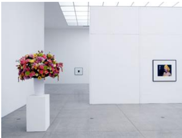
Jeroen de Rijke / Willem de Rooij, Bouquet IV , 2005

Begleitende Texte zwingen dem Bild, dem Blumenstrauß, der kunstvoll im Raum arrangiert ist, massive Bedeutung auf. Formale und gesellschaftspolitische Fragestellungen treffen aufeinander. So tritt durch die Ergänzung des Textes bei Bouquet II die Schönheit der Blumen, bestätigt und garantiert durch abendländische Kunst- und Kulturgeschichte 7 , in Konkurrenz zu anderen Auffassungen von Schönheit, in dem Fall weiblicher Schönheit, Tugend und Moral, die letztendlich zu den im Begleittext erwähnten Ausschreitungen bei der Misswahl in Nigeria führen.